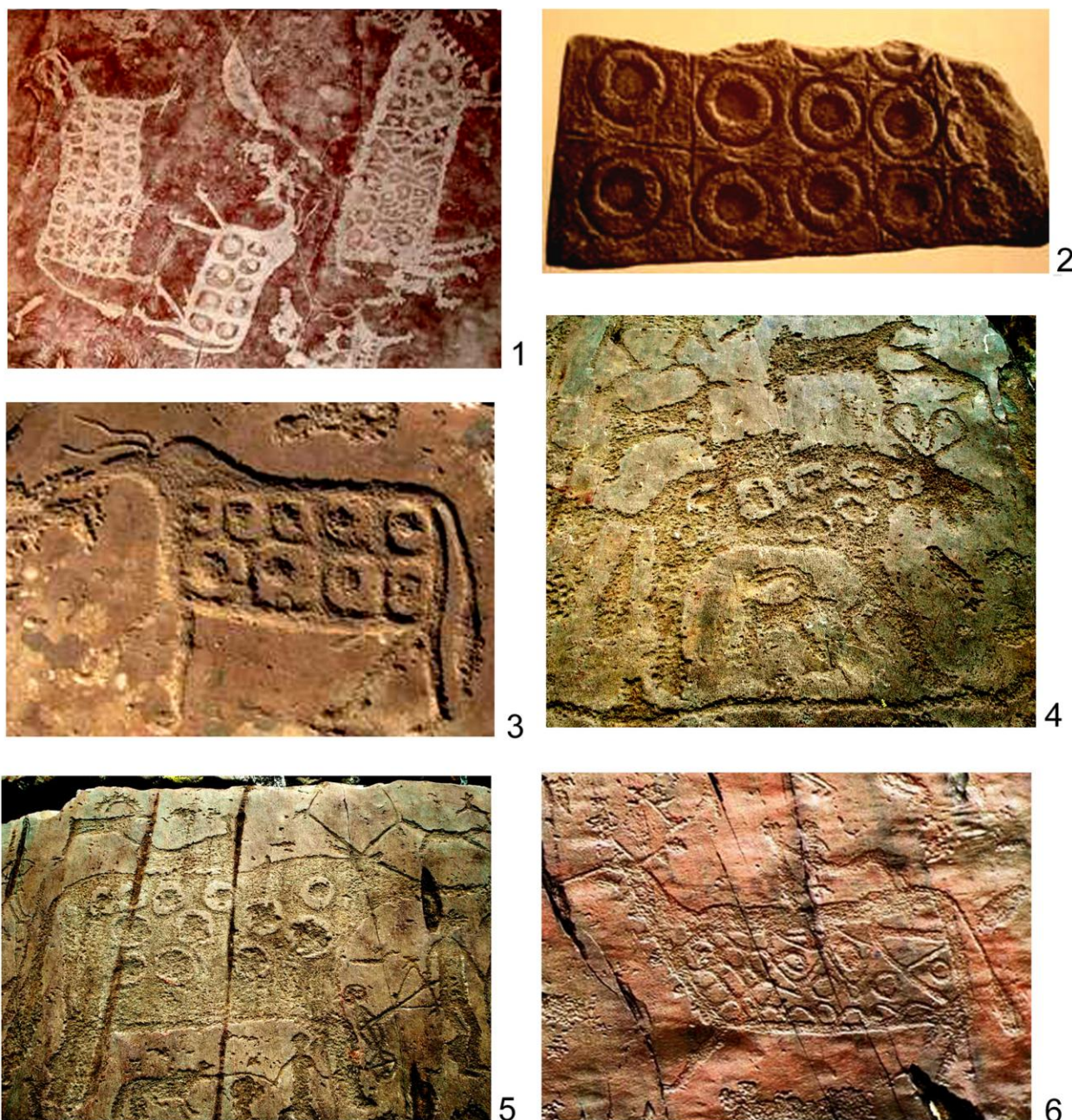
Рис. 2 1 . Изображения и знаки с Алтая и Передней Азии: 1, 3-6 – наскальные рисунки быков; святилище Калбак-Таш, Алтай; 2 – настенная панель с «глазным орнаментом». Ниневийский период. Fig. 2. Pictures and signs from the Altai and Southwest Asia