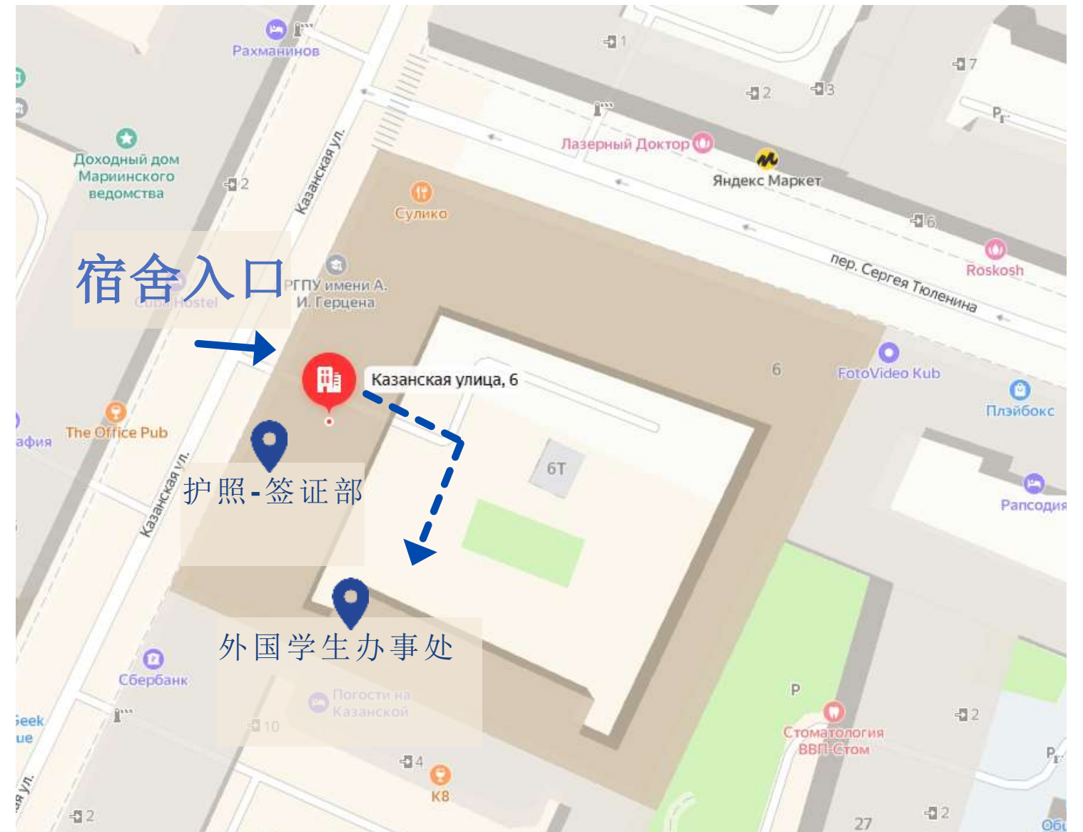
外国学生办事处 入口位于宿舍后院