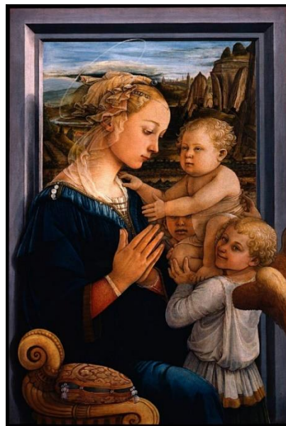
Филиппино Липпи Мадонна с младенцем и двумя ангелами.

5.5. Посмотрите репродукции художников разных исторических эпох, соотнесите изображение ребенка с определенным историческим временем.