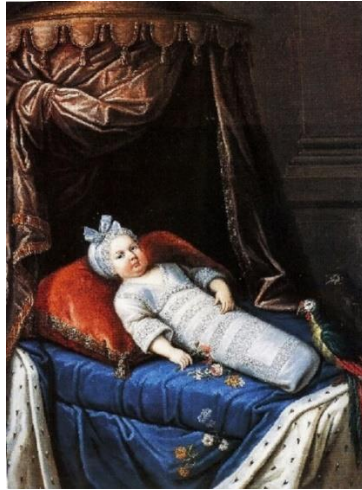
неизвестный французский художник Портрет ребенка, предположительно Людовика XIV на кровати