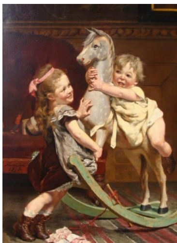
Эдгард Пьер Жозеф Farasyn Лошадка качалка

5.3. Посмотрите репродукции художников разных исторических эпох, соотнесите изображение ребенка с определенным историческим временем.