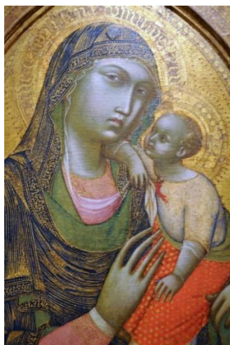
Барнаба да Модена Мадонна с младенцем