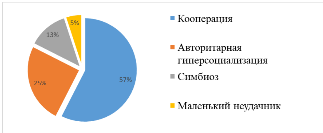
Рисунок 3.2. Типы родительского отношения у детей с адекватной самооценкой