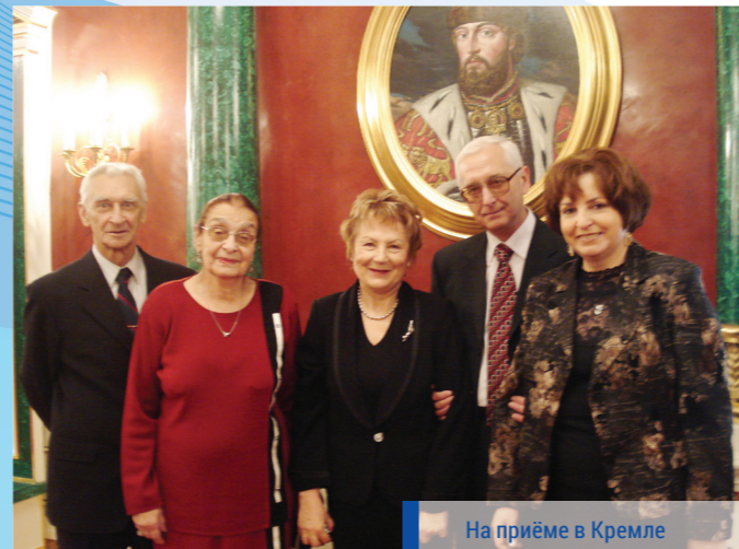
На приёме в Кремле

учёным, которые успешно сочетают научно-исследовательскую, научно-методическую, учебную и организационную работу. Ей принадлежат 547 публикаций (из которых более 50 — в зарубежных изданиях), отражающих широту её научных интересов, связанных с различными областями научного знания: историей языка, социолингвистикой, стилистикой прессы, лингводидактикой, лингвокультурологией, межкультурной коммуникацией. Опубликованные на материале докторской диссертации две монографии «Тип газеты и стиль публикации. Опыт социолингвистического исследования» (1989) и «Язык газеты и типология прессы. Социолингвистическое исследование» (2005) до сих пор не утратили