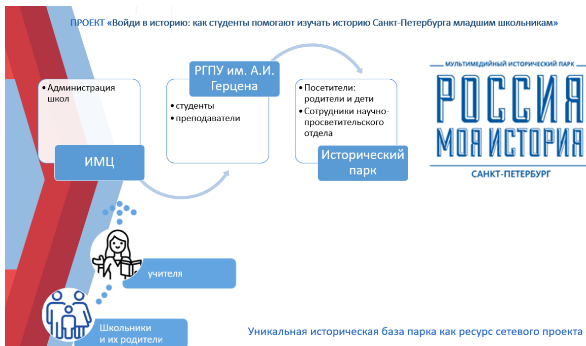
Рис. 2. Механизм сетевого партнерства в реализации проекта «Войди в историю: как студенты помогают изучать историю Санкт-Петербурга младшим школьникам»