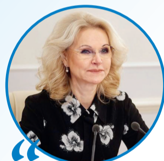
ТАТЬЯНА ГОЛИКОВА, Председатель оргкомитета по проведению в РФ Года семьи, вице-премьер

Семья — это не просто основа государства и общества, это духовное явление, основа нравственности. <...> Сбережение и приумножение народа России — наша задача на предстоящее десятилетие, и сразу скажу больше — на поколения вперед. Это будущее Русского мира, тысячелетней, вечной России.