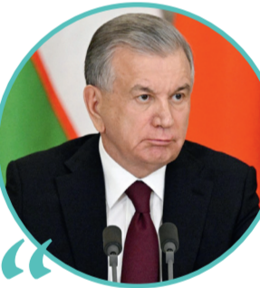
ШАВКАТ МИРЗИЙЕВ, Президент Республики Узбекистан

При обсуждении взаимодействия в культурно-гуманитарной сфере приоритетное внимание уделяли вопросам образования. Констатировано, что успешно реализуется совместный проект, совместная инициатива «Класс!» («Зур!»), нацеленная на повышение качества преподавания в Узбекистане русского языка и общеобразовательных предметов на нём. В школы Узбекистана направляются российские учителя, ведётся также переподготовка узбекских педагогов.