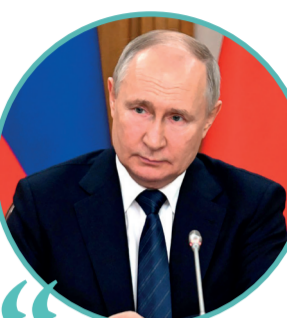
ВЛАДИМИР ПУТИН, Президент Российской Федерации

При обсуждении взаимодействия в культурно-гуманитарной сфере приоритетное внимание уделяли вопросам образования. Констатировано, что успешно реализуется совместный проект, совместная инициатива «Класс!» («Зур!»), нацеленная на повышение качества преподавания в Узбекистане русского языка и общеобразовательных предметов на нём. В школы Узбекистана направляются российские учителя, ведётся также переподготовка узбекских педагогов.