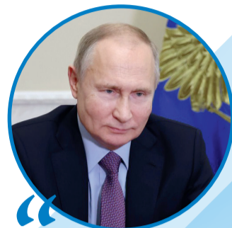
ВЛАДИМИР ПУТИН, Президент Российской Федерации

Семья — это не просто основа государства и общества, это духовное явление, основа нравственности. <...> Сбережение и приумножение народа России — наша задача на предстоящее десятилетие, и сразу скажу больше — на поколения вперед. Это будущее Русского мира, тысячелетней, вечной России.